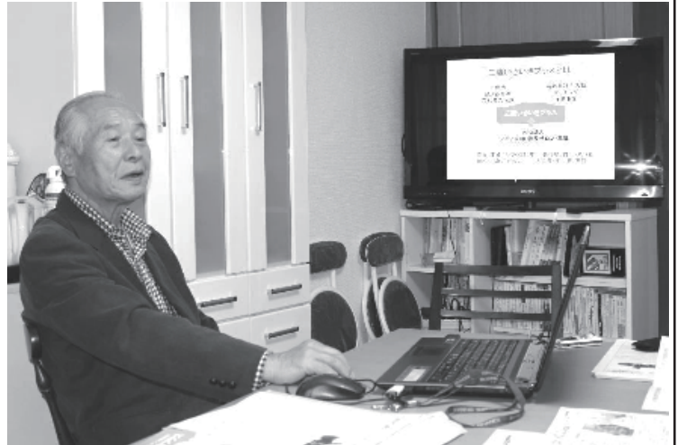
11月25日 みたか・みんなの広場

マッチングで会員を増やそうと言っても、実績がないとなかなか難しいですね。シニアSOHOのメンバーが、「広め隊」という体制を組んで、いろいろなところを回って、個人会員や法人会員登録をお願いしました。