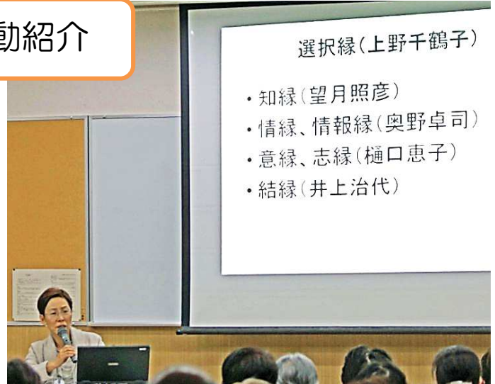
上野千鶴子さん講演会（2012.3.31） 於 三鷹市市民協働センター大会議室