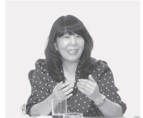
8月26日 みたか・みんなの広場

事業所にも「 特定事業所 」というのがあって、24時間連絡が取れる事業所もあります。そういうことを頭に置いていたらと良いと思います。