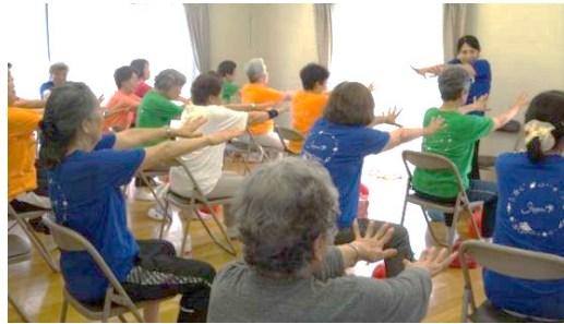
いきいきサロン活動の様子

いきいきサロン事業は、週一回高齢者が5名以上集まって体操をして（体操をすることが基本的な条件です）、2時間くらい交流をする団体に市が年間20万円の助成をするものです。特徴としては、無断欠席の場合、安否確認をすることがあります。無断欠席された方のお宅に行ったら倒れていて、救急車で緊急入院し、一命をとりとめた、ということもありました。安否確認は何もないときは大変かもしれませんが、こういうことがあると、やはり大事な、としました。